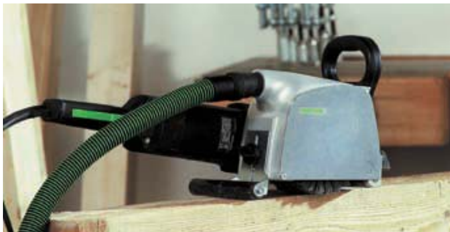
Щёточная машинка RUSTOFIX для быстрого и простого структурирования деревянных поверхностей – идеально подходит для санации старых и фактурных конструкций.