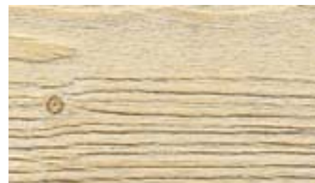
Структурировано с помощью щётки LD 85.