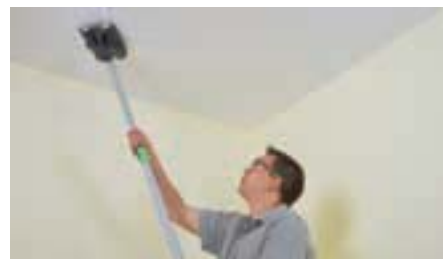
Благодаря телескопической ручке работа в помещениях с высокими потолками не представляет проблем.