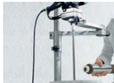
Идеальное дополнение к перемешивателю: миксерная стойка выполняет работу, пока Вы заняты другим.

Очень многие виды работ по-прежнему требуют больших затрат сил и времени – и зачастую только потому, что никому ни разу не пришло в голову разработать для этого оптимальный инструмент.