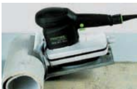
Машина TPE-RS 100 позволяет быстро и без особых усилий удалять ковровые покрытия.