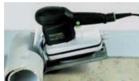
Прочный нож обеспечивает высокую производительность при удалении покрытия.