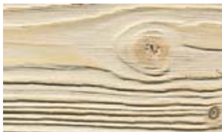
Отшлифовано с помощью щётки KB 80.