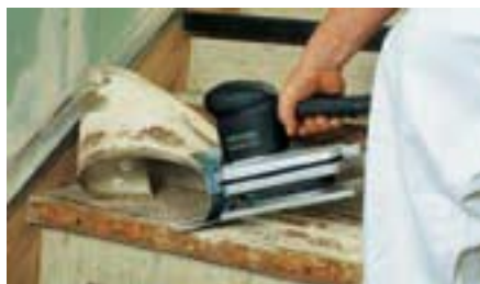
Подходит для работы на лестницах благодаря компактности конструкции.

Вибронож линейным движением врезается между основой и клеевым слоем и выполняет работу за Вас. Вам остаётся лишь слегка направлять и продвигать его. Быстрее и проще не бывает.