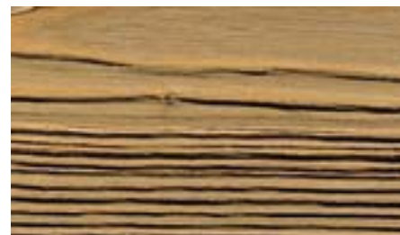
Выглажено и зачищено с помощью щётки BG 85.