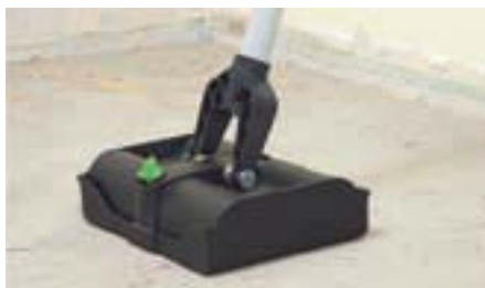
Защитный кожух для чистой и безопасной транспортировки.