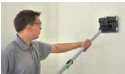
Регулировка глубины защищает грунтовое покрытие от повреждений.

FAKIR агрессивно относится к обоям и деликатно – к стене. Ввиду того, что не все обои одинаковы, глубину проникновения валиков можно регулировать под конкретный тип обоев. Это защищает грунтовое покрытие от повреждений. Такой совершенно новый принцип действия снижает затраты сил и позиционирует перфоратор обоев FAKIR как отличный инструмент для помещений с высокими потолками.