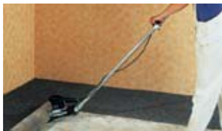
В ненапряженной позе гораздо легче работать. Регулируется в зависимости от роста.