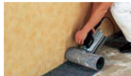
Машинка для удаления ковровых покрытий незаменима и при обработке углов.