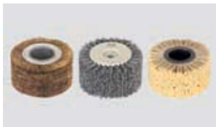
Три щётки для структурирования, шлифования и гладкой затирки: три технологические операции одним инструментом.

Для замены в два счёта: достаточно одного поворота ключа.